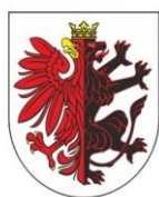
Marszałek Województwa Kujawsko-Pomorskiego