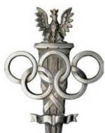
Prezes Polskiego Komitetu Olimpijskiego

Michał Zaleski - Prezydent Miasta Torunia