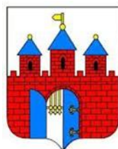
PREZYDENT BYDGOSZCZY Rafał Bruski