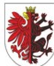
MARSZAŁEK WOJEWÓDZTWA KUJAWSKOPOMORSKIEGO Piotr Całbecki