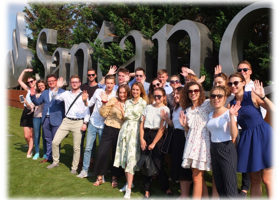
Wizyta studyjna studentów Uniwersytetu Ekonomicznego w Poznaniu w Santander Global Head Office, Boadilla del Monde (Hiszpania).

Więcej o naszym zaangażowaniu w edukację znajdą Państwo w raporcie rocznym CSR: raport.santander.pl