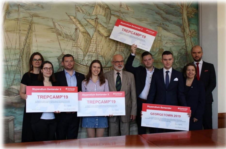
Wręczenie symbolicznych czeków finansujących uczestnictwo w programach globalnych dla studentów Szkoły Głównej Handlowej w Warszawie.